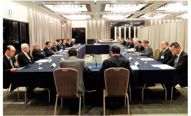
平成29年度第2回理事会